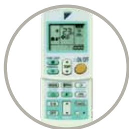
Infračervené diaľkové ovládanie (štandard) ARC433B70