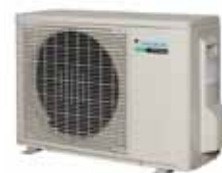
Vonkajšia jednotka RX71GV

Tento prospekt bol zostavený iba na informačné účely a nepredstavuje záväznú ponuku spoločnosti Daikin Europe N.V. Spoločnosť Daikin Europe N.V. zostavila obsah tohto letáku podľa svojich najlepších vedomostí. Nedáva ani výslovnú, ani implicitnú záruku za úplnosť, presnosť, spoľahlivosť alebo vhodnosť na určitý účel jeho obsahu a tu prezentovaných produktov a služieb. Technické údaje sa môžu zmeniť bez predchádzajúceho upozornenia. Spoločnosť Daikin Europe N.V. otvorene odmieta akúkoľvek zodpovednosť za akékoľvek priame alebo nepriame škody v širšom slova zmysle, vyplývajúce z alebo vzťahujúce sa k používaniu a/alebo interpretácii tohto letáku. Celý obsah je chránený autorskými právami spoločnosti Daikin Europe N.V.