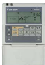
Bedrade afstandsbediening (optie)